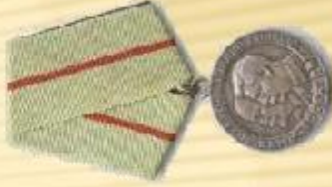
Медаль «Партизану Отечественной Войны 1 степени»