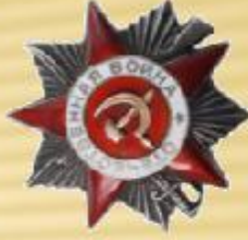
Орден Отечественной Войны 2 степени

III Всероссийский дистанционный конкурс "Мастер мультимедийных технологий"