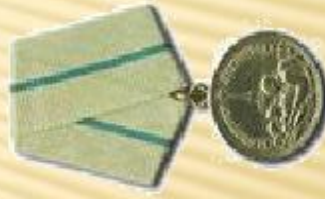
Медаль «За оборону Ленинграда»