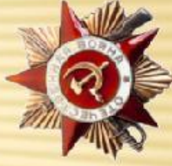
Орден Отечественной Войны 1 степени