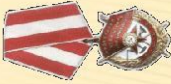
Орден Боевого Красного знамени