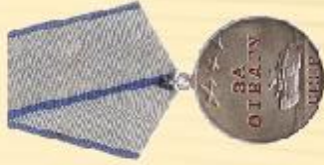
Медаль «За отвагу»